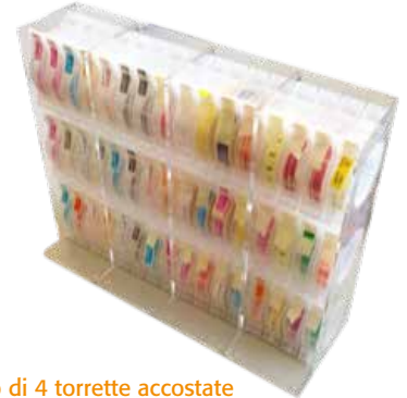
Esempio di 4 torrette accostate con 48 cartucce Labelkit Ex. 4 Towers hold 48 labelkit cartridges

Disponibili diversi accessori: richiedete il nostro depliant specifico per scegliere i più adatti alle vostre esigenze! Various accessories available, ask for our specific brochure.